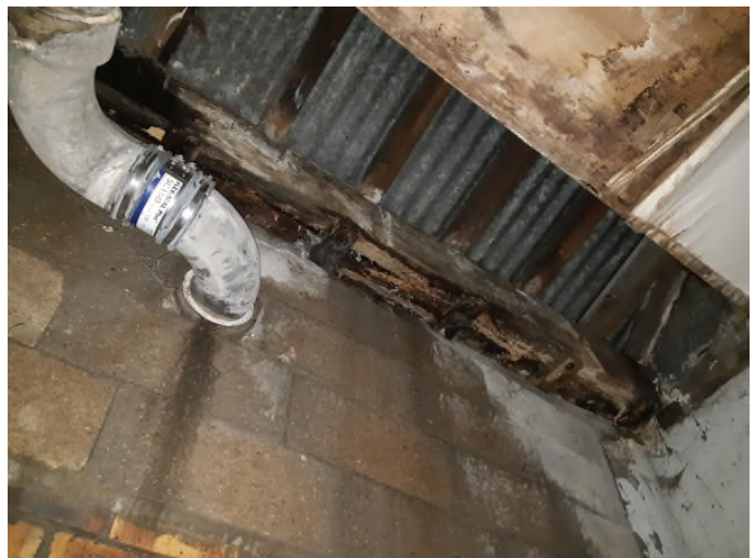
Appentis côté rue du Hameau : Poutre bois très abîmée et couverture en fibrociment