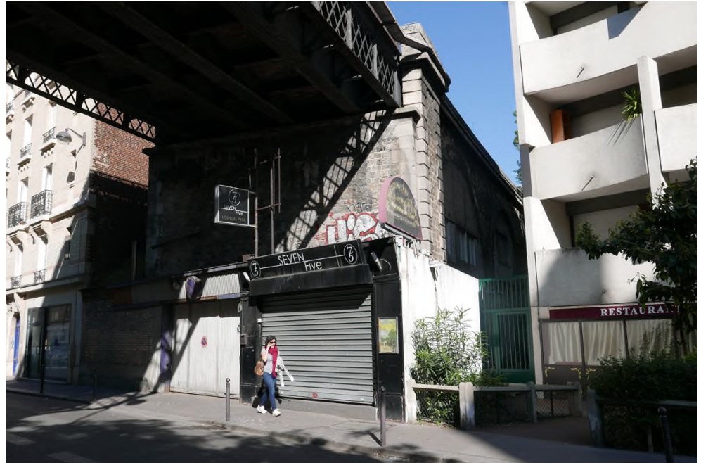
A droite du viaduc, rue du Hameau