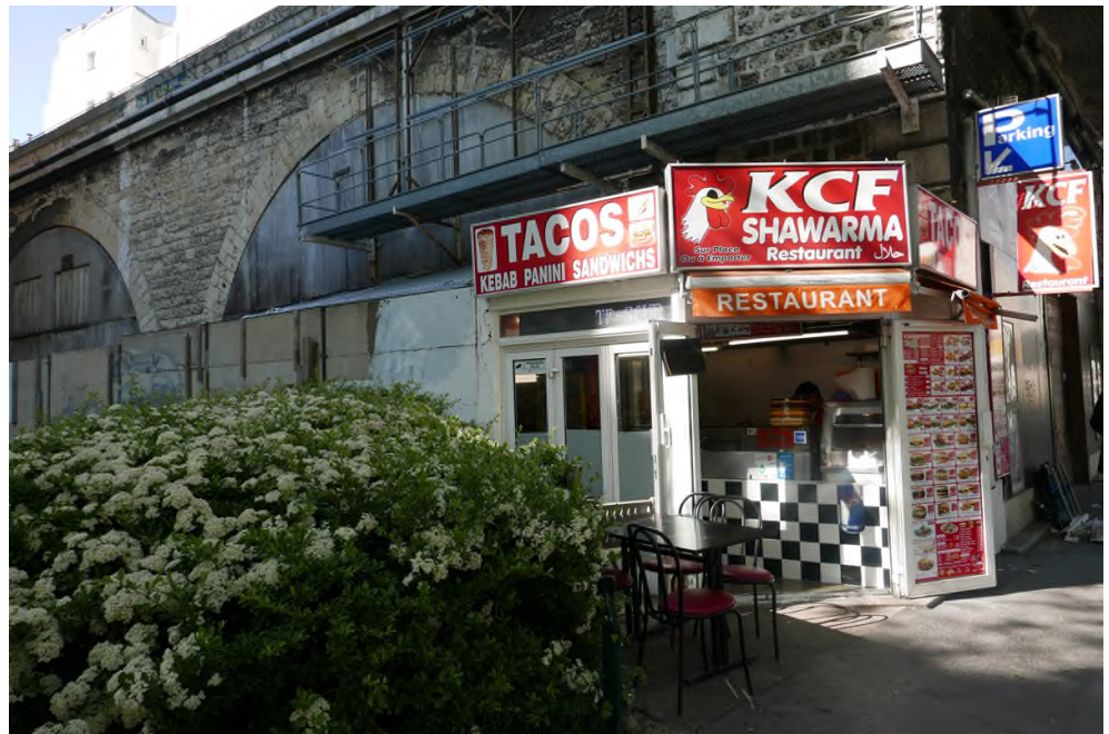
A gauche du viaduc, rue de Vaugirard