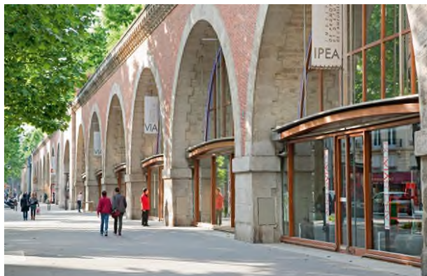
Viaduc des Art de l'avenue Daumesnil (Paris XII). La largeur de la rue latérale du viaduc de la rue de Vaugirard sera limitée à 4 m environ.

Certaines cellules pourraient également comporter une mezzanine sans que cela influence les propos précédents, et il serait même possible de réaliser des ERP restants en 5 ème catégorie qui cumuleraient plusieurs arches mitoyennes.