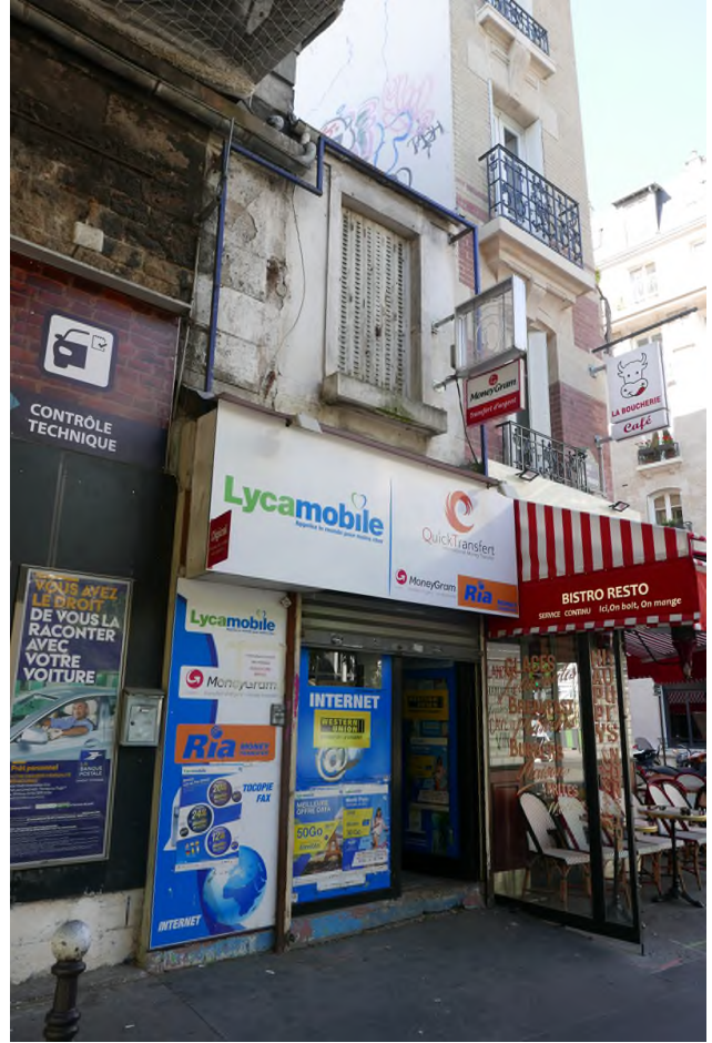
A droite du viaduc, rue de Vaugirard